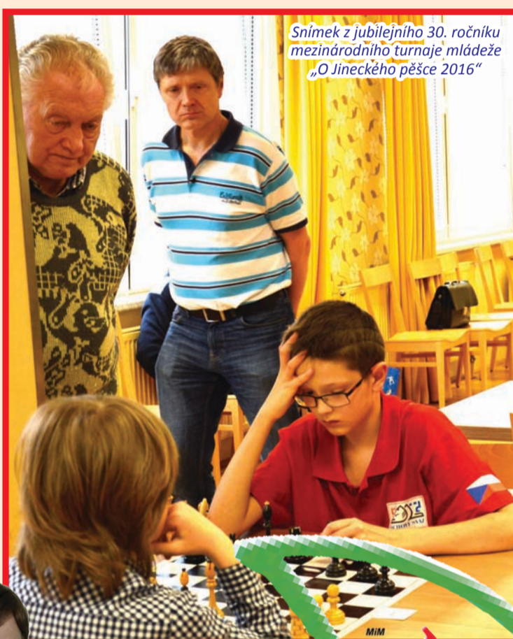
Snímek z jubilejního 30. ročníku mezinárodního turnaje mládeže „O Jineckého pěšce 2016“