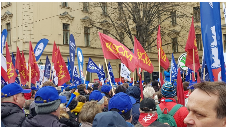
KSČM na demonstraci odborů proti vládě, z Letné před Strakovku.

Duben 2023 OKRESNÍ VÝBOR KSČM PRAHA-VÝCHOD