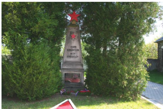
Hřbitov ve Staré Boleslavi

V Brandýse nad Labem – Staré Boleslavi se uskutečnily pietní akty ve dvou dnech. V neděli 8. května se konal pietní akt na hřbitově ve Staré Boleslavi a na hřbitově v Brandýse následující den v pondělí 9. května. ZO KSČM Brandýs již tradičně zajišťuje připomenutí konce druhé světové války i v Jenštejně a Přezleticích.