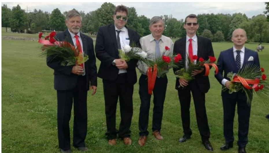
Na pietním aktu v Lidicích mezi několika předsedy OV KSČM

Již 29. setkání komunistů a sympatizantů pod Velkým Blaníkem se letos koná v sobotu 3. července od 10.00 hod. Vystoupení kandidátů KSČM pro sněmovní volby, hudba, zábava, občerstvení – to vše v malebném přírodním prostředí na úpatí bájně hory.