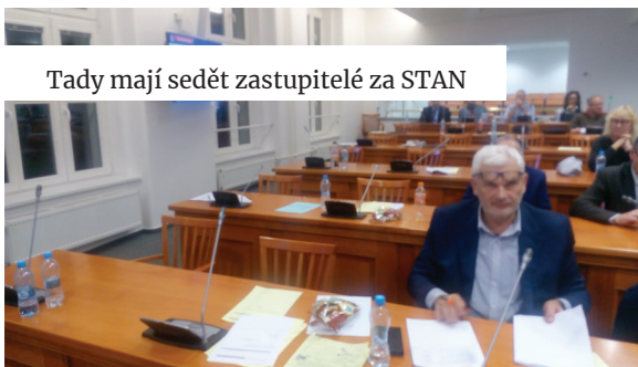
Tady mají sedět zastupitelé za STAN